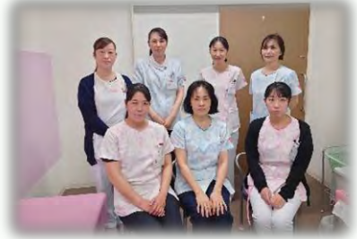
外来スタッフと共に

患者さんの療養指導に直接係る機会はありませんが、資格取得後に始めた頸動脈超音波検査を実施する際、カルテで病歴、服薬、経過等を確認し患者さんをより理解して検査に臨めるようになりました。わからないことも医師、看護師に聞きやすくなりコミュニケーションをとれるようになったと思います。